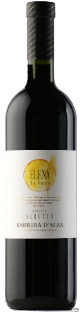
Erhältlich in 75 cl